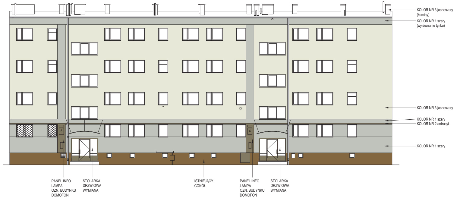
1 Elewacja front 1 : 100