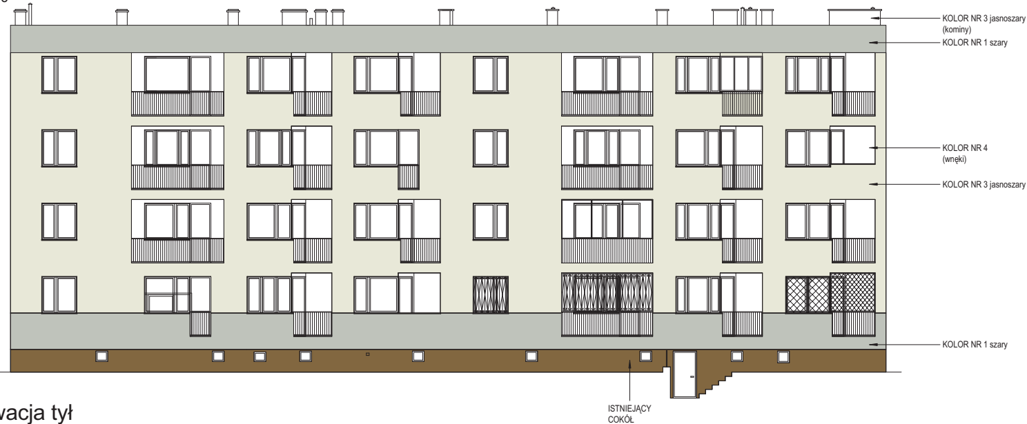
2 Elewacja tył 1 : 100

UWAGA: kolorystyka elewacji nawiązująca do koloru elewacji budynku przy ul. Śluza 4AE